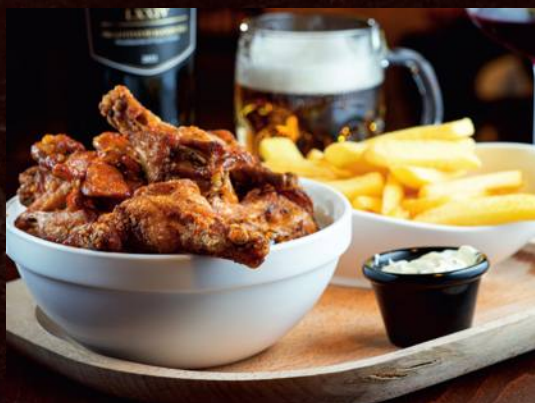
GRILOVANÉ KURACIE KRÍDEĽKÁ PODÁVANÉ S CHILLI MASLOM, GARLIC 3,7 /BEZLEPKOVÉ/ GRILLED CHICKEN WINGS WITH CHILLI BUTTER GARLIC /GLUTEN-FREE/