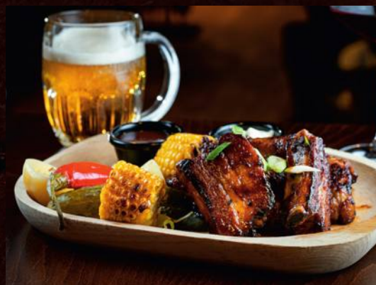
PEČENÉ BRAVČOVÉ REBRÁ, GARLIC A BBQ 3,7 /BEZLEPKOVÉ/ ROASTED PORK RIBS, GARLIC & BBQ /GLUTEN-FREE/