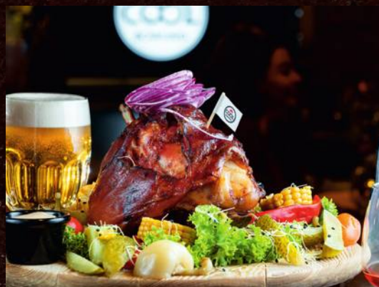
BAVORSKÉ BRAVČOVÉ KOLENO, HORČICA, SMOTANOVÝ CHREN, FEFERÓNY, BARANIE ROHY, KYSLÁ UHORKA, CHLIEB 1,7,10 BAVARIAN PORK KNUCKLE, MUSTARD, CREAM HORSERADISH, PEPPERONI, CHILLI, PICKLED CUCUMBER, BREAD