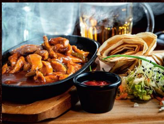
PIKANTNÉ KURACIE FAJITAS S TORTILLOU NA PANVIČKE 1,3,7 SPICY CHICKEN FAJITAS WITH TORTILLA ON THE PAN